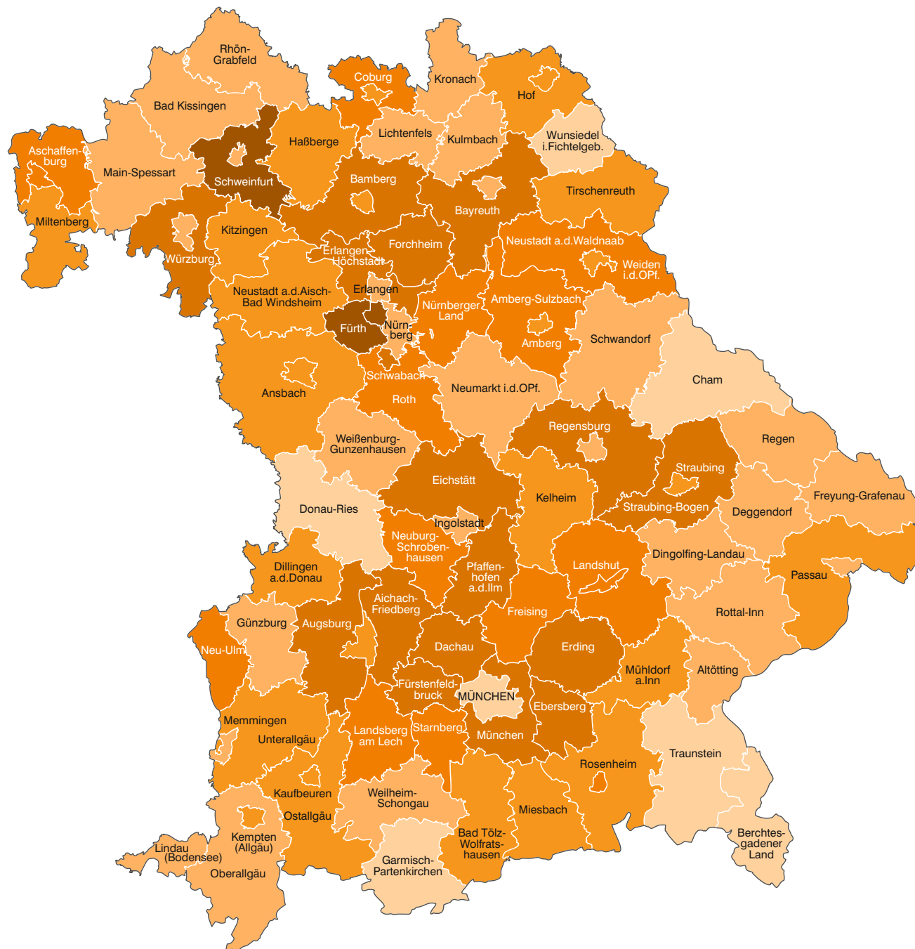
Abb. 1 Anteil der Auspendler an den sozialversicherungspflichtig Beschäftigten am Wohnort in den kreisfreien Städten und Landkreisen Bayerns am 30. Juni 2018 in Prozent